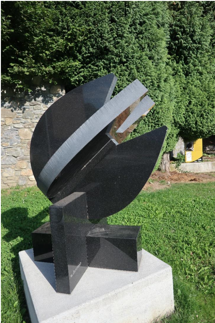
Oœur ouvert ou croix de cœur - Square Anne Tobé au Plateau d'Assy