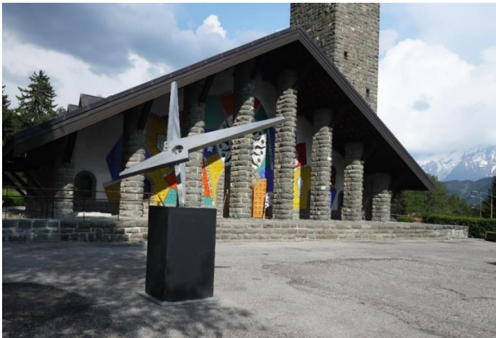
Inauguration de "Génération Hommage à Saint-Exupéry" devant l'église Notre Dame de Toute Grâce au plateau d'Assy