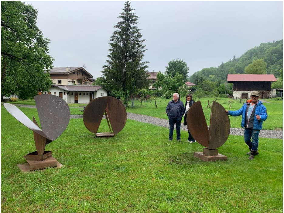
Mise en place de "Flore Faune Minéral" au parc Biolley à Chedde