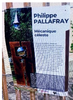
Œuvre de Philippe Pallafray aux côtés de "Flore Faune Minéral" au parc Biolley