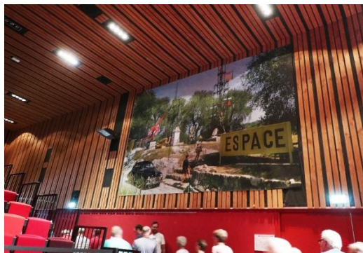
Parvis des Fiz : “Oblique mobile” de Descombin -Affiche Expo Groupe Espace (Biot 1954) Photo Tibislawsky - Moment musical avec le Quintet Vincent Lê Quang ...