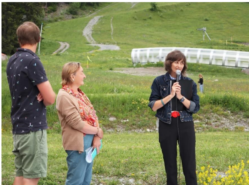
Intervention de Mme Chatrian à Plaine Joux : inauguration de "NOU" et de la route peinte