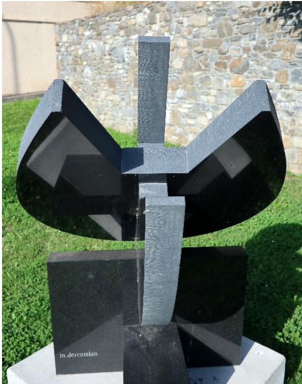
“Cœur ouvert” ou “Croix de cœur”

« le langage non parlé est le fruit silencieux de la quête partagée ».