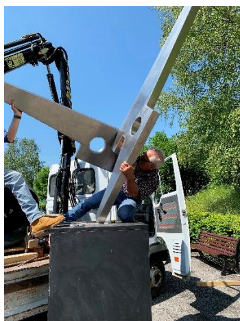
Mise en place de “Génération hommage à Saint-Exupéry” au Plateau d’Assy devant l’église Notre Dame de Toute Grâce