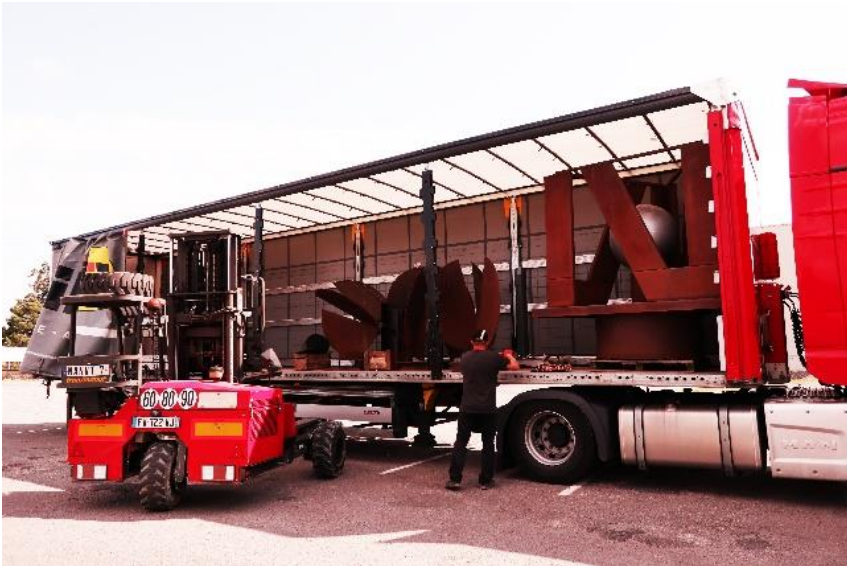
Chargement prêt pour le départ