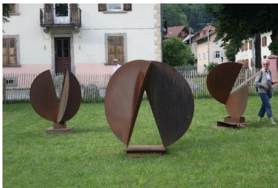
Parc Biolley : “Flore Faune Minéral “. Sculpture sérielle de Maxime Descombin

Trois règnes : Le minéral, le végétal, l’animal. Comment évoquer avec simplement trois demi-disques, la position de celle ou de celui qui cherche à situer la place de l’humain dans l’évolution de notre planète dans le cosmos...Vaste sujet de réflexion.