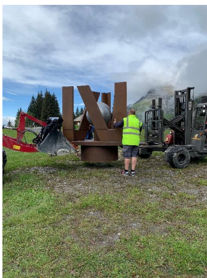
Mise en place de "NOU" à Plaine Joux face au Mont Blanc avec les employés municipaux