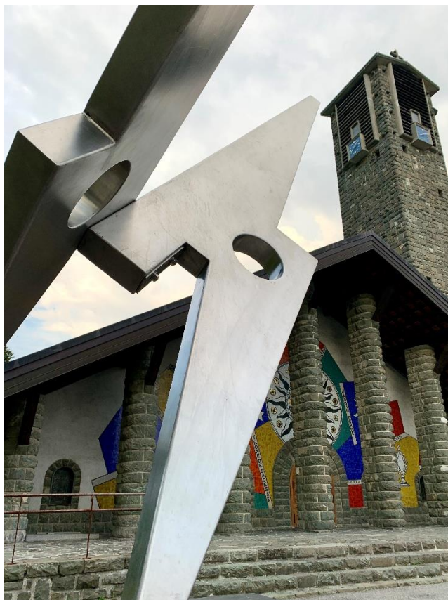
"Génération " au Plateau d'Assy : photo François Joly