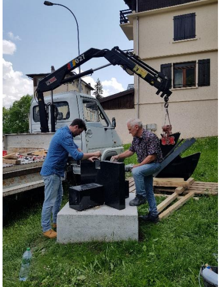
Montage : atelier Lapierre-Rofani à St Maurice de S. Montage : Plateau d'Assy le 5 juin 2023