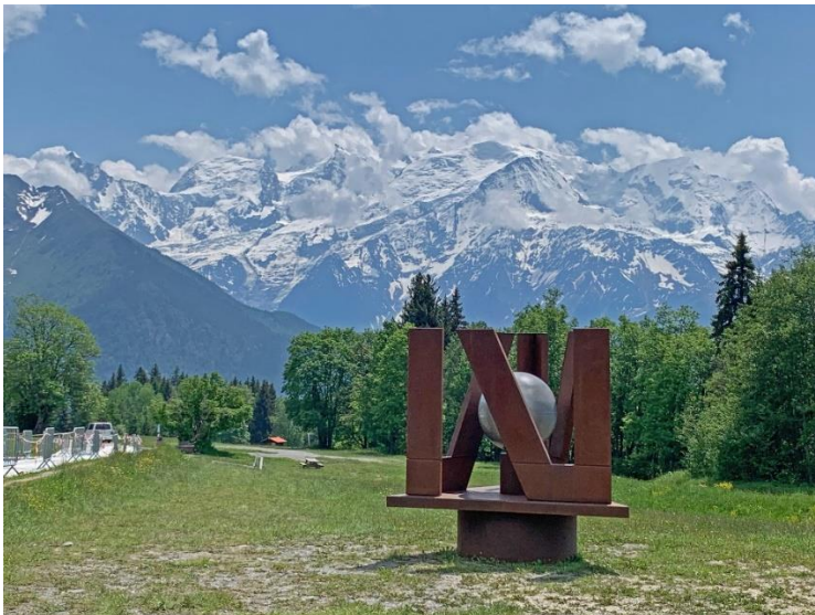
"NOU" face au Mont Blanc à Plaine Joux