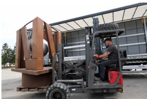
Chargement de "NOU" : de la cour de l'atelier au camion Alainé