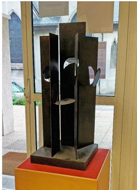
"Pouvoir des simples" Bibliothèque de Chedde