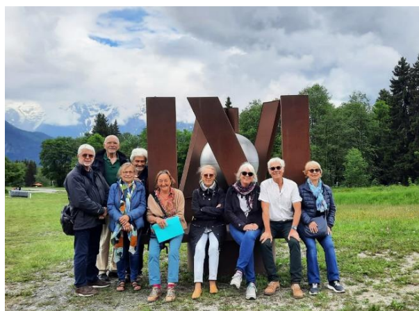
Une partie des membres de l'APAD présents lors de l'inauguration