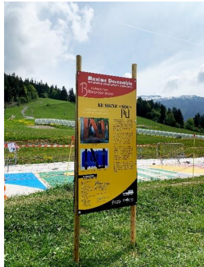
“NOU” à Plaine Joux