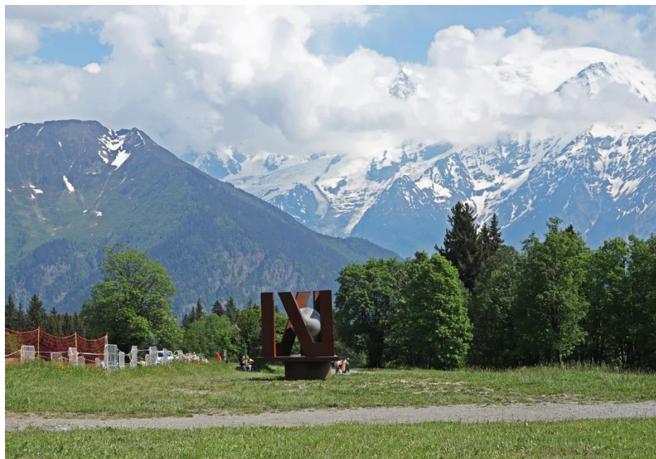
“NOU” face au Mont Blanc