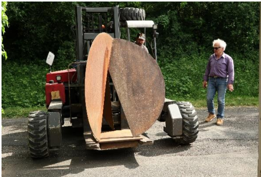
Enlèvement de "Flore Faune Minéral"