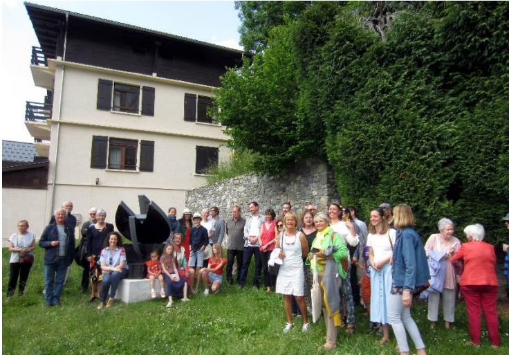
Inauguration de la sculpture "Cœur ouvert" de Maxime Descombin