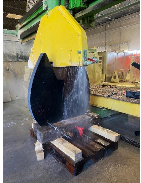
"Coeur ouvert"- Découpage des plaques de granite du Zimbabwe