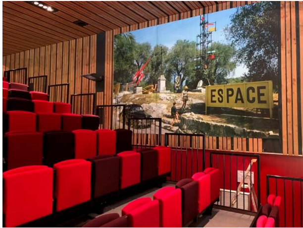
"Oblique mobile"- Expo Groupe ESPACE à Biot en 1954. Photo Tibislawsky Exposition 2023 au Parvis des Fiz